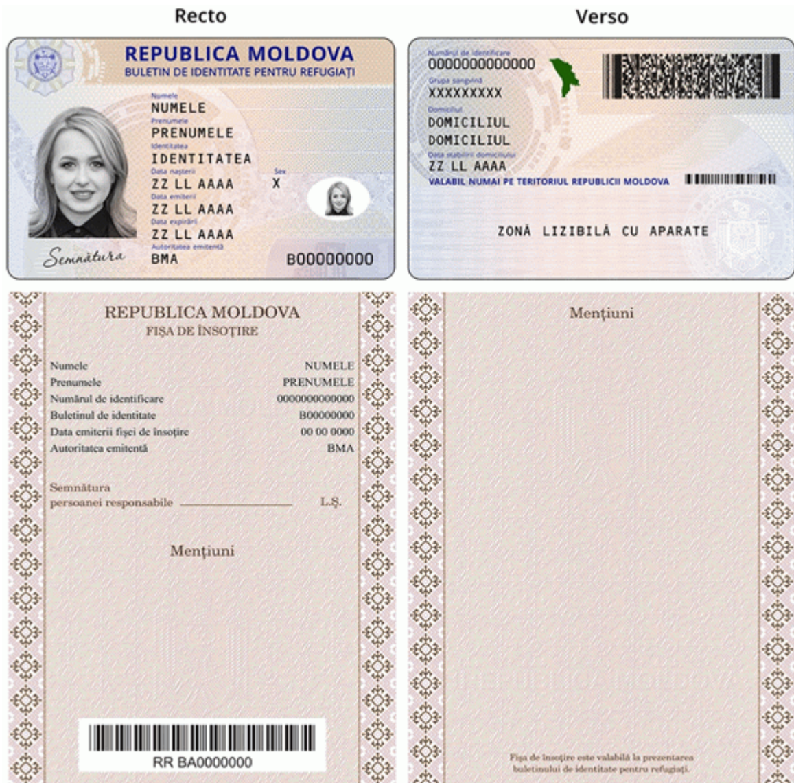
Des.9.2. Modelul buletinului de identitate pentru refugiați cu fișa de însoțire (generația II) emis în anul 2016