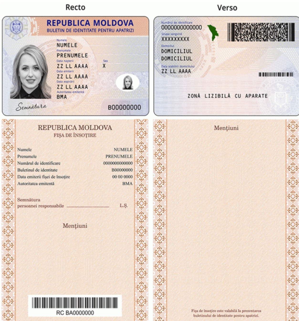
Des.5.2. Modelul buletinului de identitate pentru apatrizi cu fișa de însoțire (generația II) emis în anul 2016