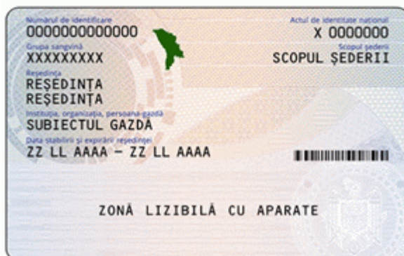
Des.8.2. Modelul permisului de ședere provizorie pentru cetățeni străini (generația II) emis în anul 2016