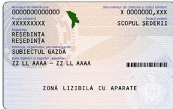
Des.7.2. Modelul permisului de ședere provizorie pentru apatrizi (generația II) emis în anul 2016