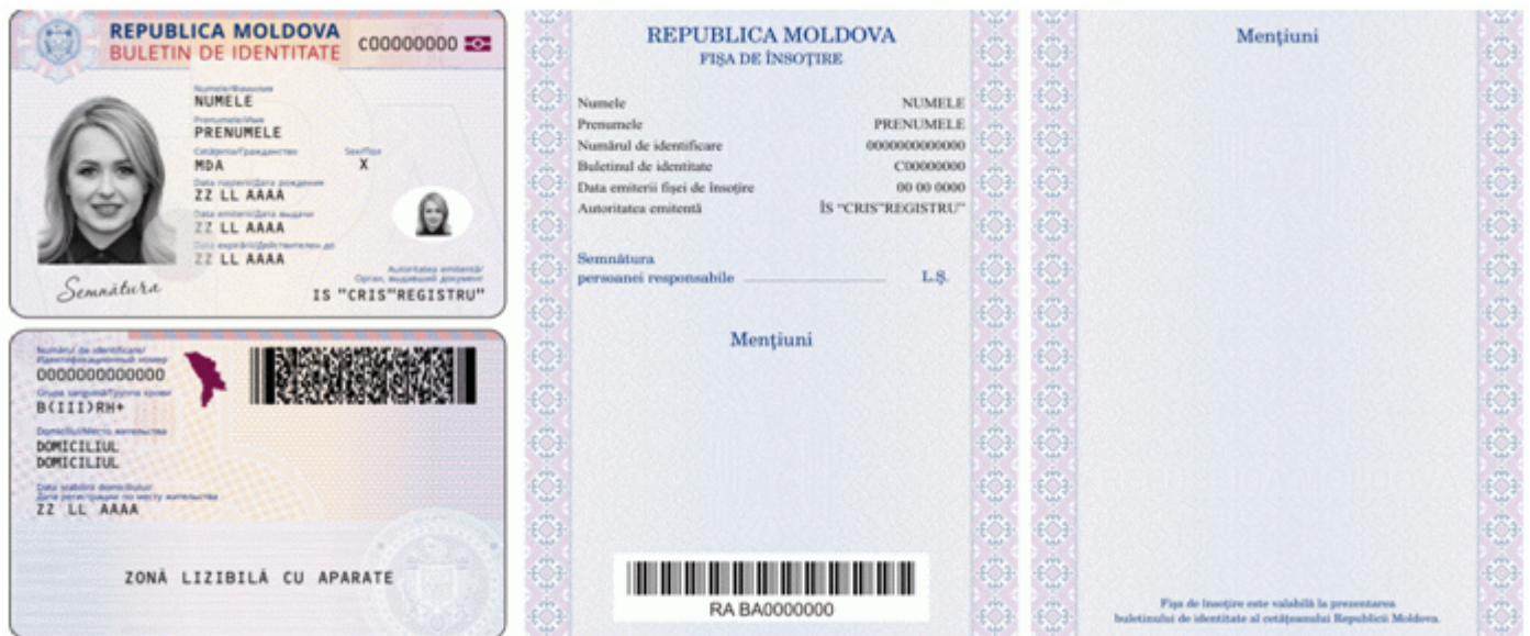
Des.4.5. Modelul buletinului de identitate electronic al cetățeanului Republicii Moldova cu fișa de însoțire (generația III) emis în anul 2015.”