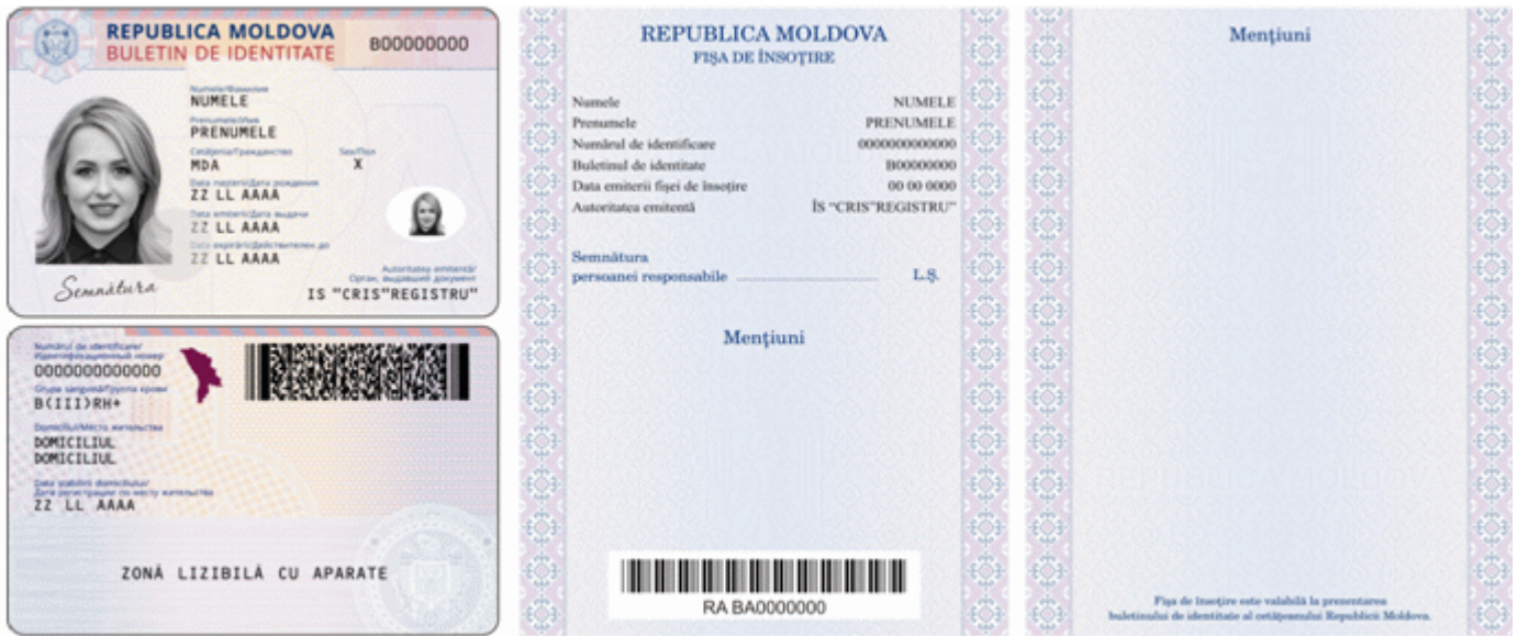
Des.4.1.1. Modelul buletinului de identitate al cetățeanului Republicii Moldova cu fișa de însoțire (generația II) emis în anul 2015.”