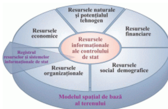
Figura 1. Locul RRSIS în structura resurselor informaționale de stat

RRSIS este parte componentă a resurselor informaționale ale controlului de stat.