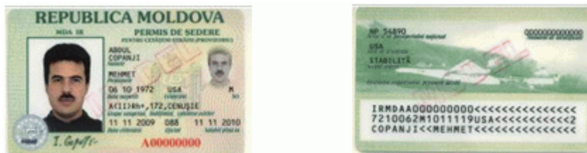
Des.8. Modelul permisului de ședere provizorie (pentru cetățeni străini) (generația I).