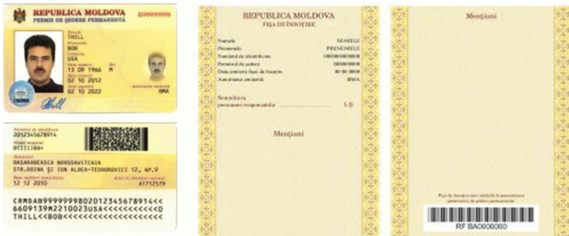
Des.6.1. Modelul permisului de ședere permanentă cu fișa de însoțire (generația II).