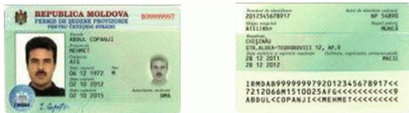
Des.8.1. Modelul permisului de ședere provizorie