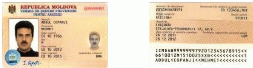
Des.7.1. Modelul permisului de ședere provizorie pentru apatrizi (generația II).