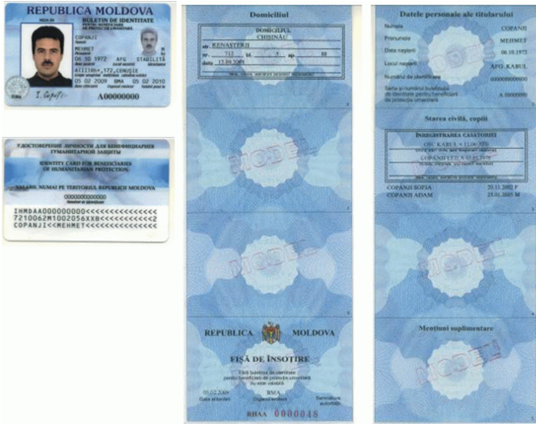
Des.10. Modelul buletinului de identitate pentru beneficiari de protecție umanitară cu fișa de însoțire (generația I).