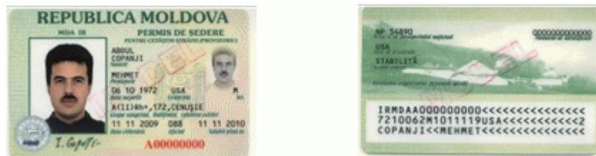
Des.8. Modelul permisului de ședere provizorie (pentru cetățeni străini) (generația I).