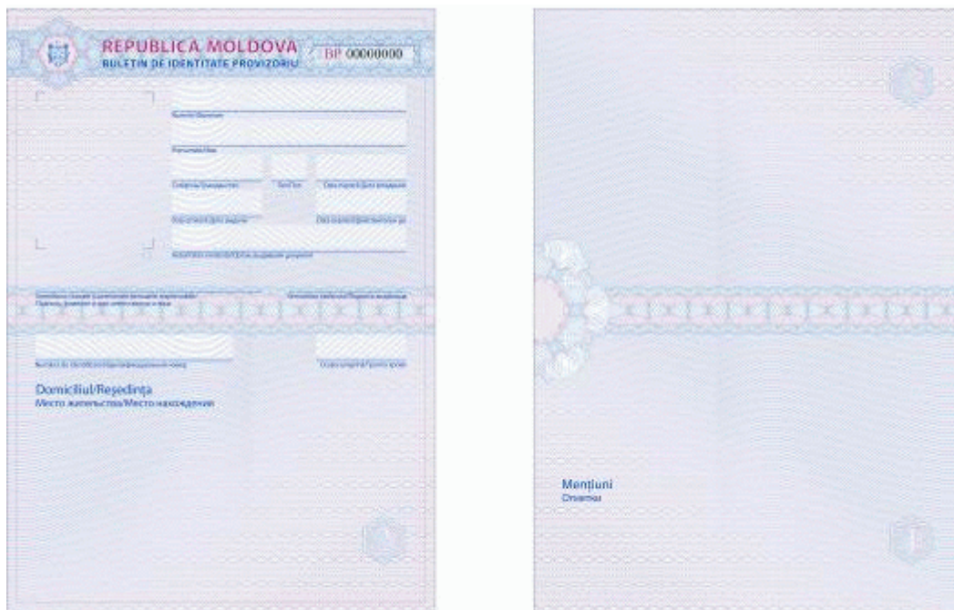
Des.4.2. Modelul buletinului de identitate provizoriu al cetățeanului Republicii Moldova.