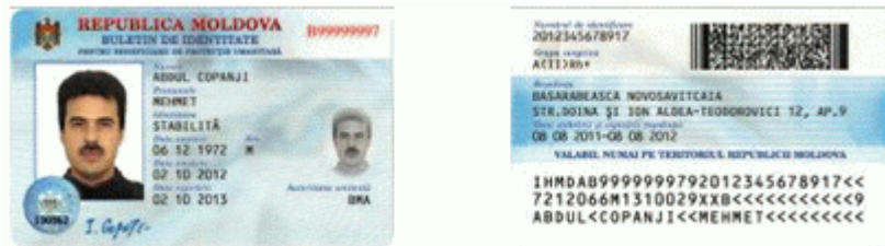
Des.10.1. Modelul buletinului de identitate pentru beneficiari de protecție umanitară (generația II).