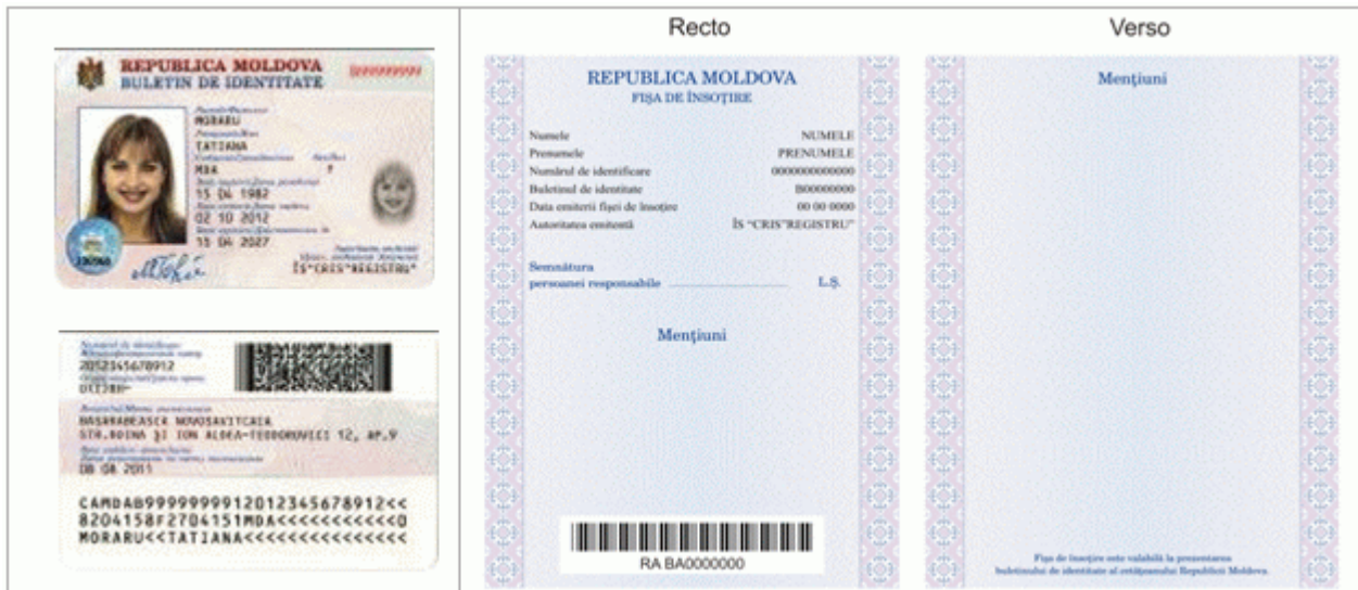
Des.4.1. Modelul buletinului de identitate al cetățeanului Republicii Moldova cu fișa de însoțire (generația II).