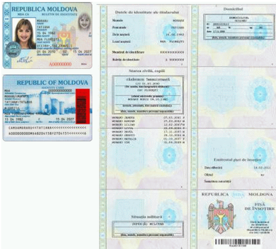
Des.4. Modelul buletinului de identitate al cetățeanului Republicii Moldova cu fișă de însoțire (generația I).

Notă: Designul și elementele de protecție ale actelor de identitate din generația I au fost perfecționate pe parcurs, iar modelele reprezentate în desene constituie ultima variantă a acestora.