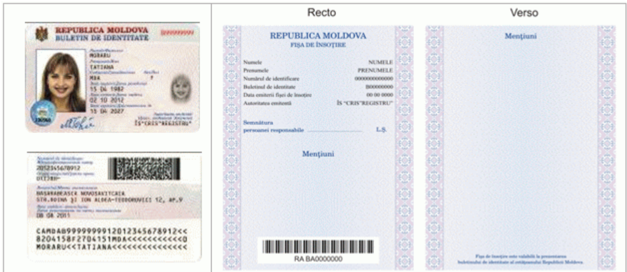
Des.4.1. Modelul buletinului de identitate al cetățeanului Republicii Moldova cu fișa de însoțire (generația II).