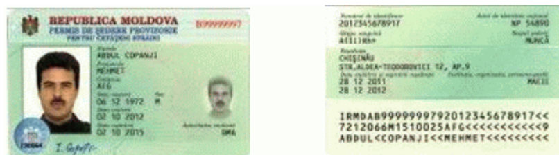
Des.8.1. Modelul permisului de ședere provizorie