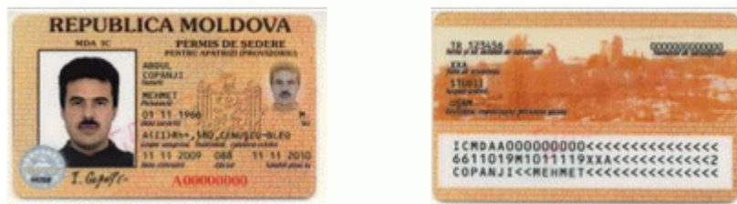
Des.7. Modelul permisului de ședere provizorie pentru apatrizi (generația I).