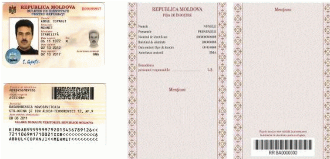
Des.9.1. Modelul buletinului de identitate pentru refugiați cu fișa de însoțire (generația II).