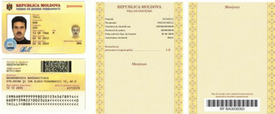
Des.6.1. Modelul permisului de ședere permanentă cu fișa de însoțire (generația II).