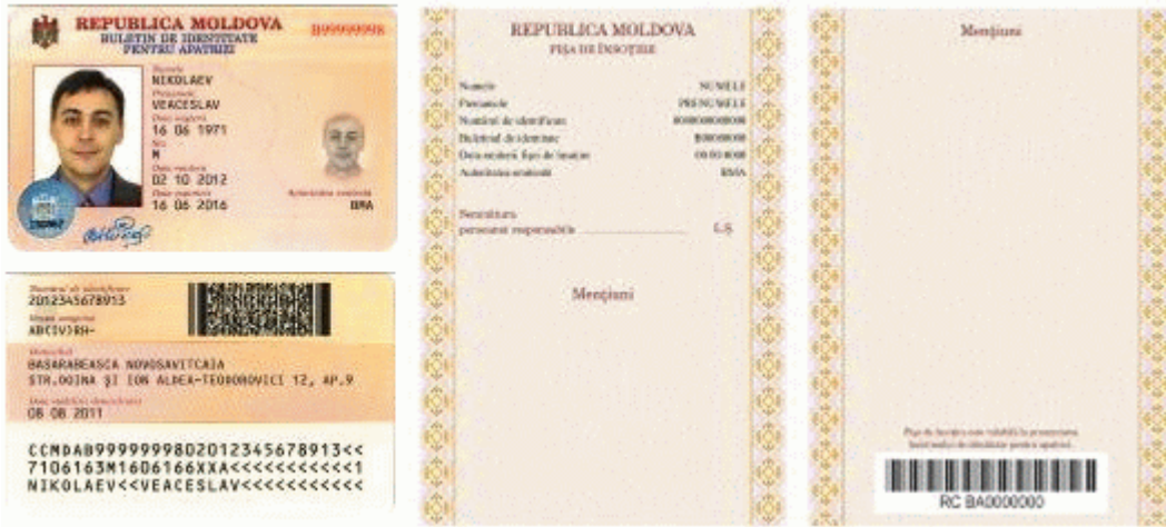
Des.5.1. Modelul buletinului de identitate pentru apatrizi cu fișa de însoțire (generația II).