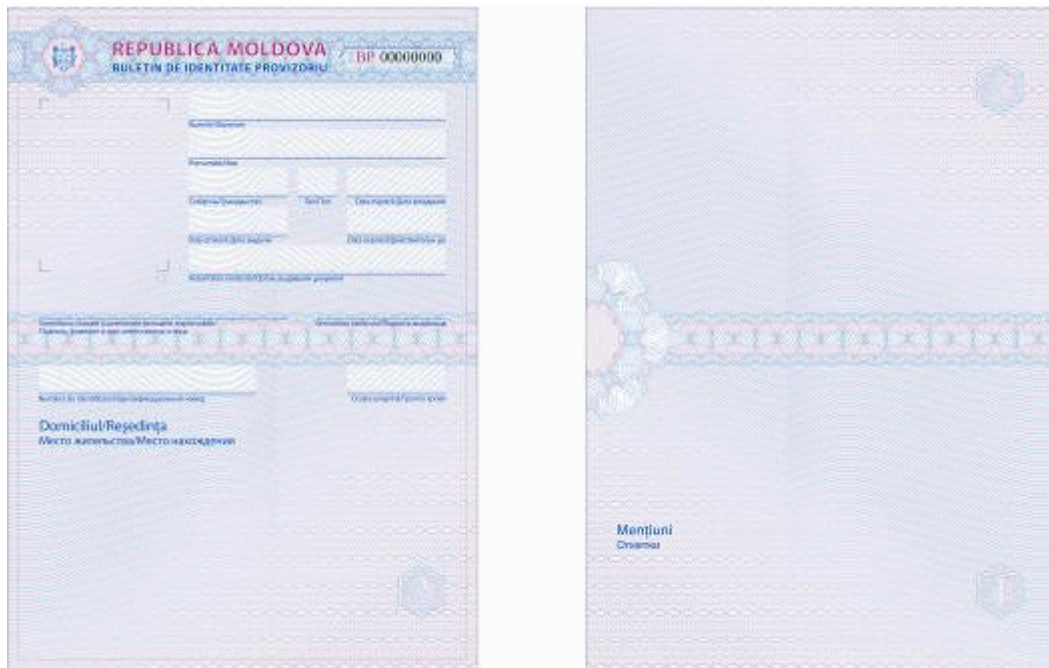
Des.4.2. Modelul buletinului de identitate provizoriu al cetățeanului Republicii Moldova.