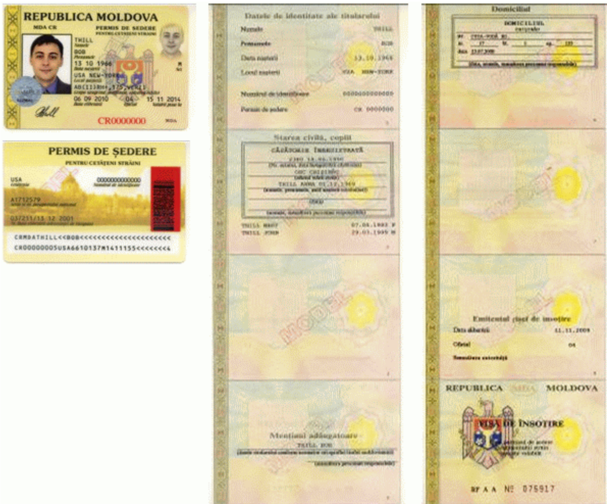
Des.6. Modelul permisului de ședere permanentă cu fișa de însoțire (generația I).