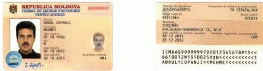
Des.7.1. Modelul permisului de ședere provizorie pentru apatrizi (generația II).