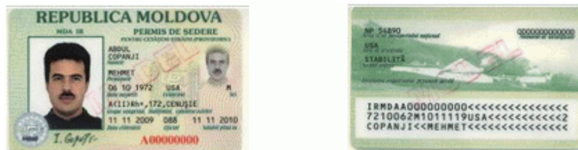
Des.8. Modelul permisului de ședere provizorie (pentru cetățeni străini) (generația I).