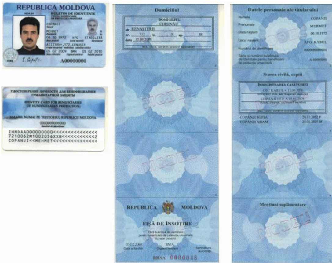
Des.10. Modelul buletinului de identitate pentru beneficiari de protecție umanitară cu fișa de însoțire (generația I).