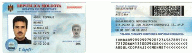
Des.10.1. Modelul buletinului de identitate pentru beneficiari de protecție umanitară (generația II).