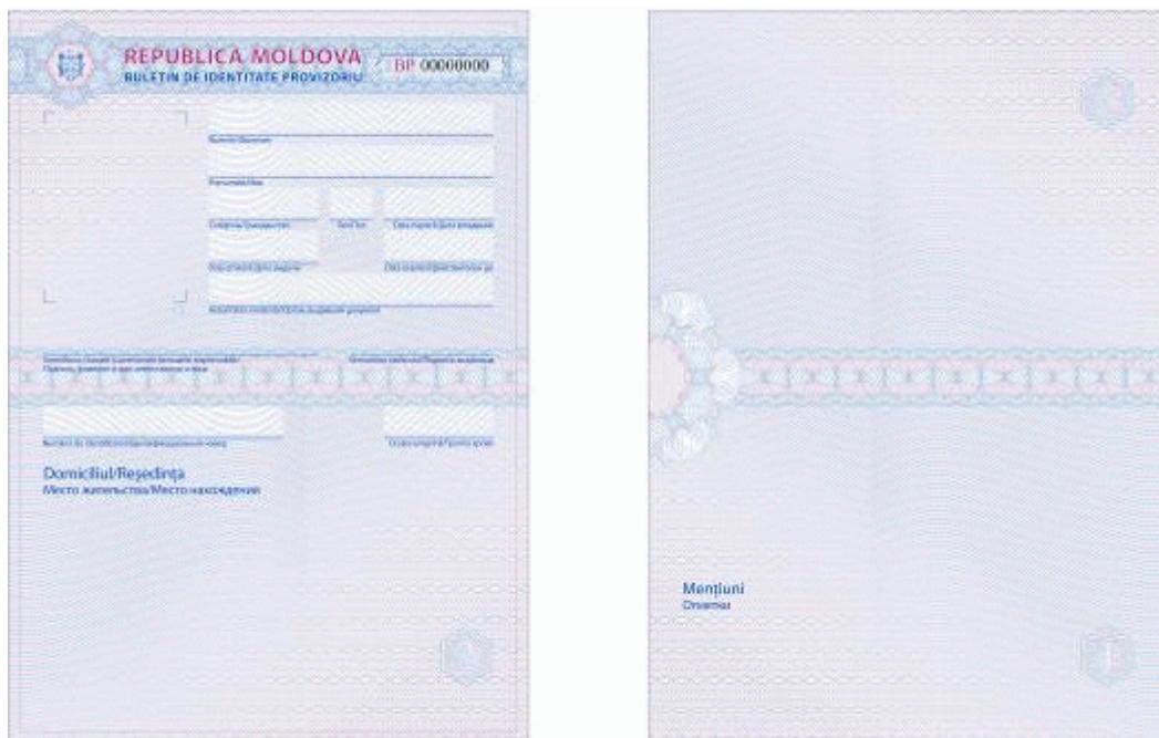
Des.4.2. Modelul buletinului de identitate provizoriu al cetățeanului Republicii Moldova.