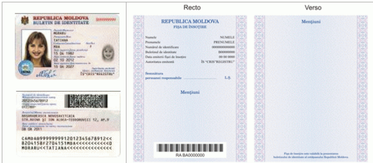
Des.4.1. Modelul buletinului de identitate al cetățeanului Republicii Moldova cu fișa de însoțire (generația II).