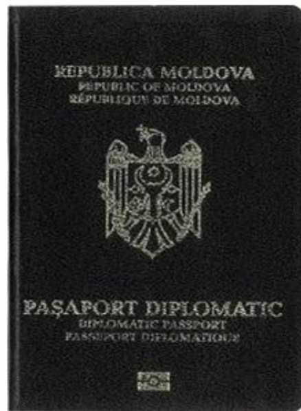
Des.11.3. Modelul pașaportului diplomatic cu date biometrice.