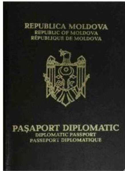
Des.11.2. Modelul pașaportului diplomatic fără date biometrice.