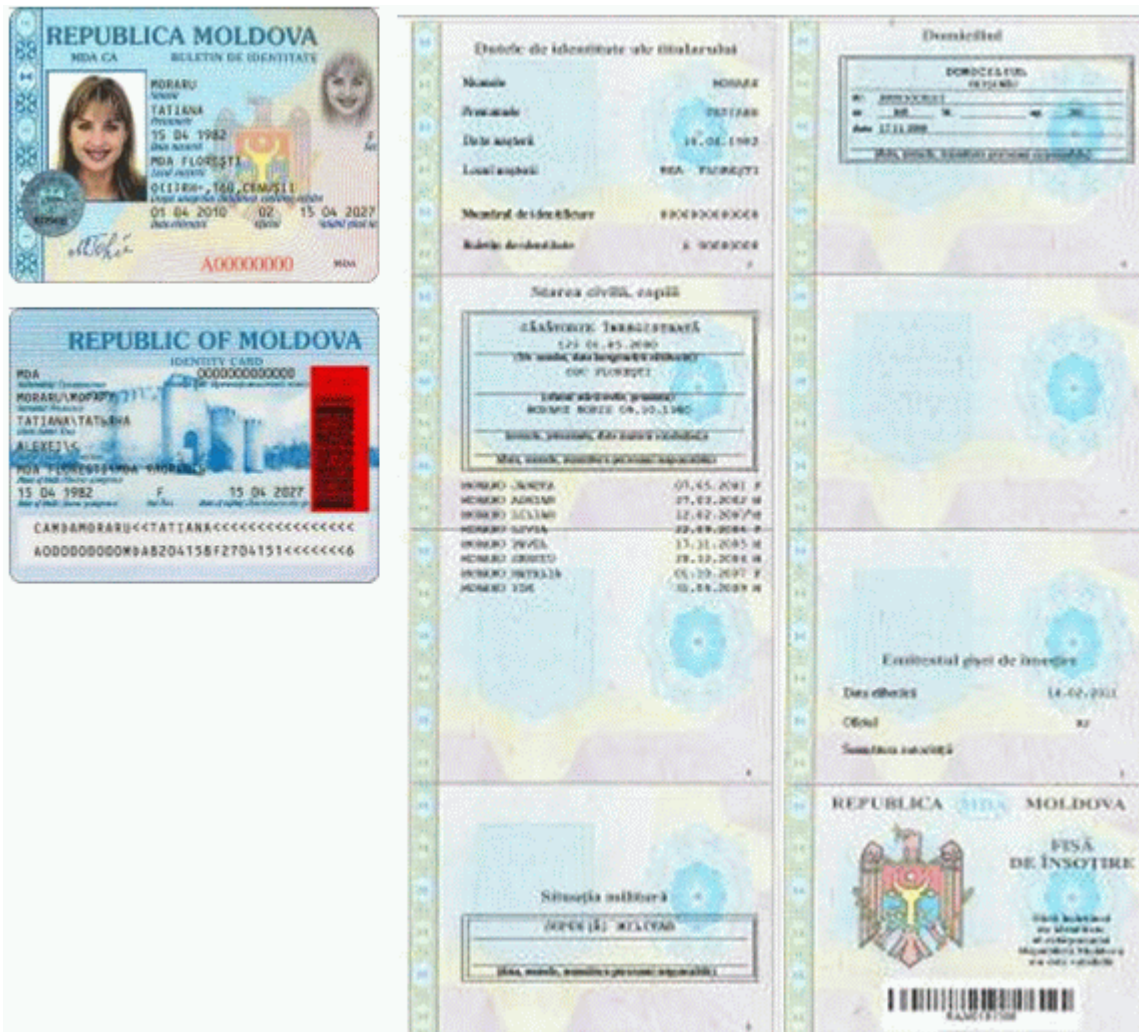
Des.4. Modelul buletinului de identitate al cetățeanului Republicii Moldova cu fișa de însoțire (generația I).

Notă: Designul și elementele de protecție ale actelor de identitate din generația I au fost perfecționate pe parcurs, iar modelele reprezentate în desene constituie ultima variantă a acestora.