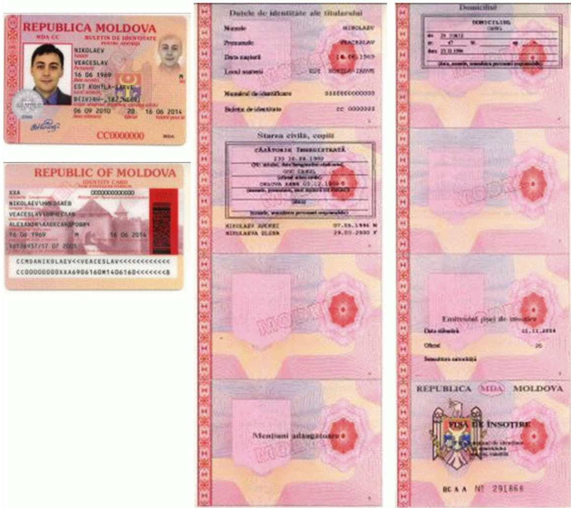
Des.5. Modelul buletinului de identitate pentru apatrizi cu fișa de însoțire (generația I).