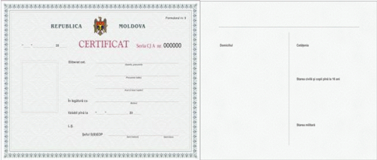
Des.4.4. Modelul actului de identitate provizoriu (Formularul nr.9) fără codul de bare.