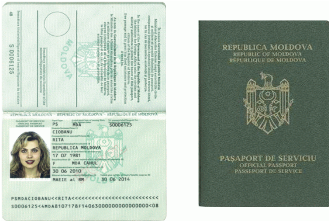
Des.11.4. Modelul pașaportului de serviciu fără date biometrice.