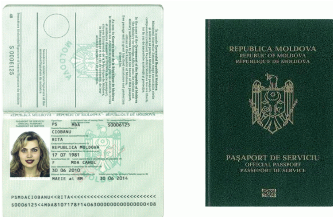
Des.11.5. Modelul pașaportului de serviciu cu date biometrice.